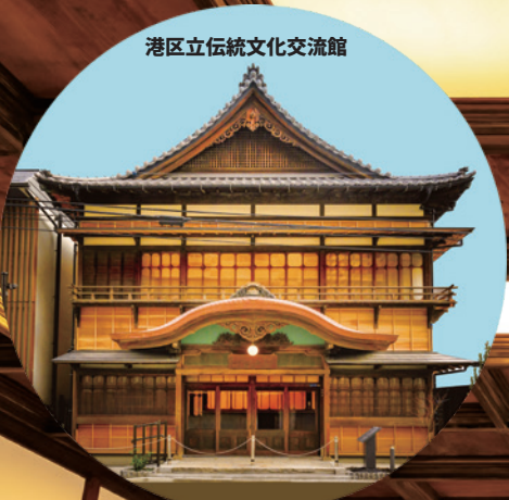
港区立伝統文化交流館

令和四年 四月九日 (土) 開場：午後2時半 開演：午後3時～4時半 会場：港区立伝統文化交流館定員：一般二十名