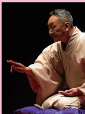
落語：遊興享福し満

会場：港区立伝統文化交流館とは「伝統文化交流館」は、港区指定有形文化財である「旧協働会館」を保存・活用して、様々な伝統文化や地域の文化に関する事業を行うことにより、伝統や文化を次世代へつなげていく施設です。